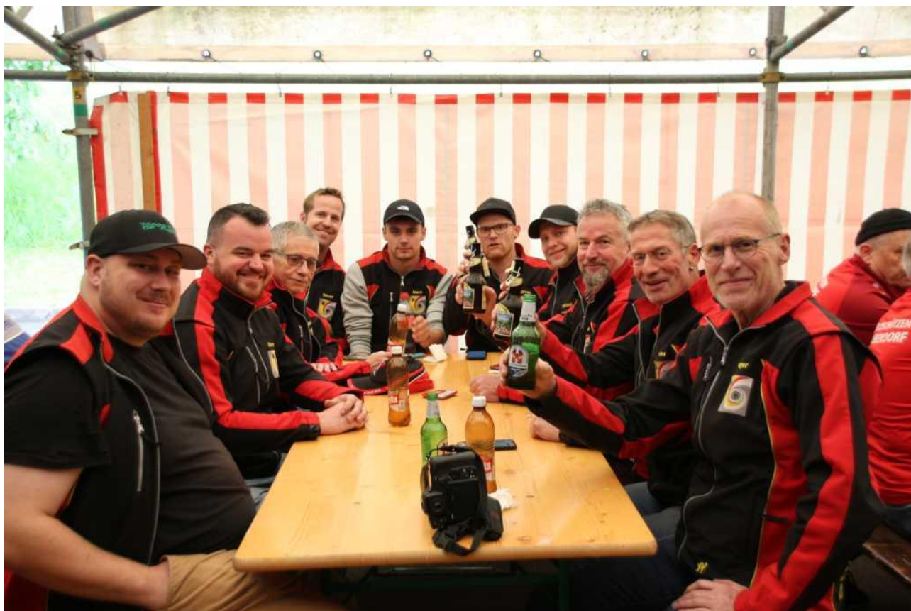
Erfolgreiche Ziefner Schützen