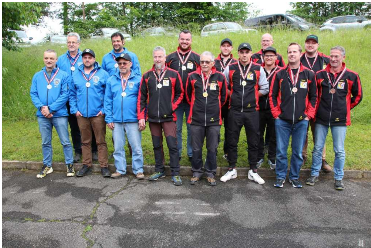
Podest Kategorie D