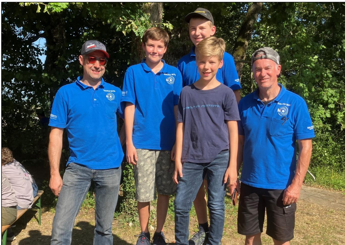
Die Gruppe der FS Bennwil mit ihren beiden JJ-Leitern am Verbandsfinal