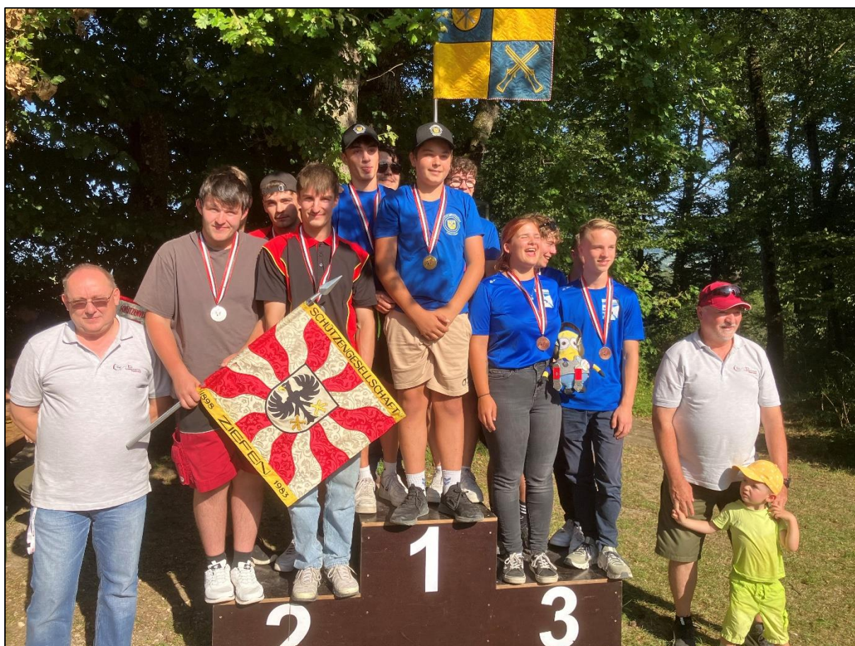
Die Gruppe I der SG Ziefen am Verbandsfinal, neben den Gruppen aus Hemmiken und Pfeffingen